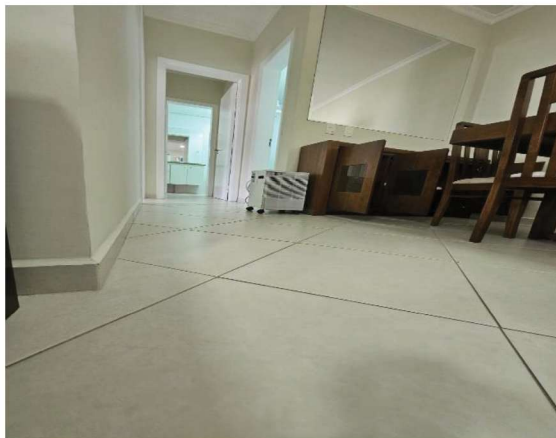
11 – Piso do Apartamento