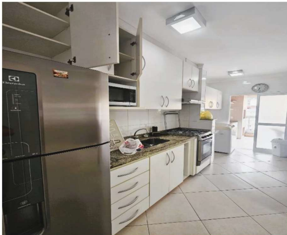
15 – Cozinha