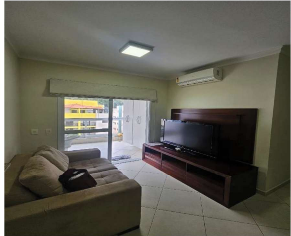
14 – Sala de Estar/TV