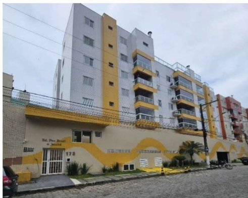
1 - Frente do Prédio