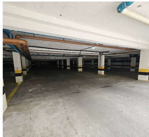
8 – Vagas de Estacionamento (1 vaga)