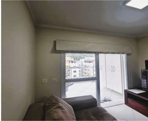
13 – Acesso da Sala para a Sacada/Varanda

Rua: José de Alencar, 21 Sala 01 Itaguá – Ubatuba/SP Cep: 11688-642 12 99791-6991 satoadv@uol.com.br