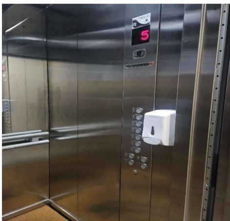
6 – Elevador do prédio