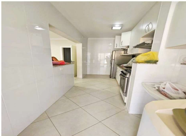
17 – Lavanderia