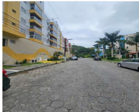
2 – Rua do Prédio (bloqueada)