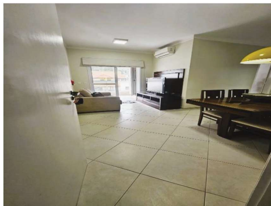
10 – Acesso ao apartamento