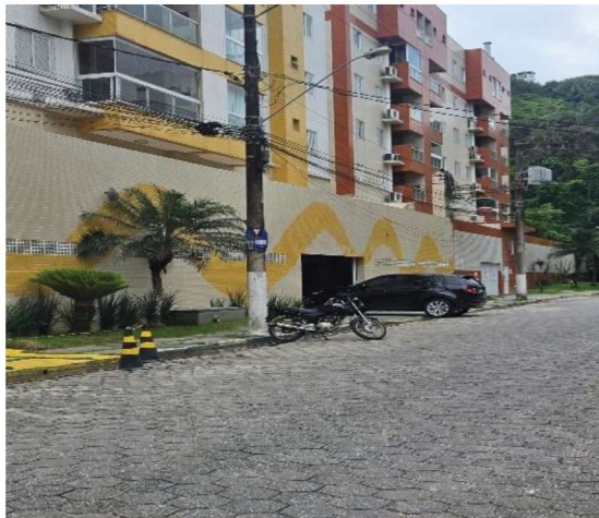
7 – Entrada do Estacionamento

Rua: José de Alencar, 21 Sala 01 Itaguá – Ubatuba/SP Cep: 11688-642 12 99791-6991 satoadv@uol.com.br