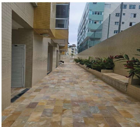
4 – Acesso Interno do Prédio