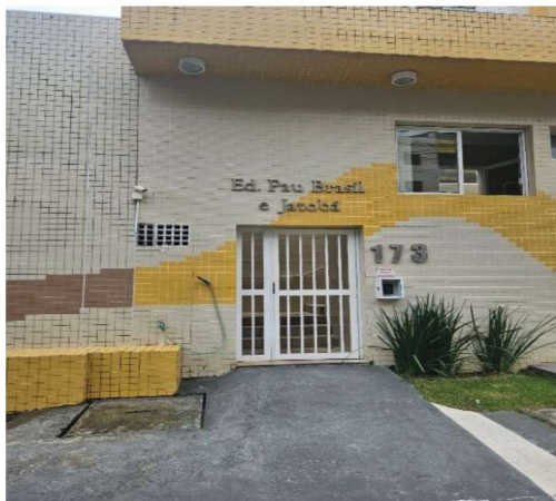
3 – Guarita (entrada de Pedestres)