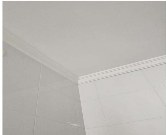
16 – Acabamento da Cozinha