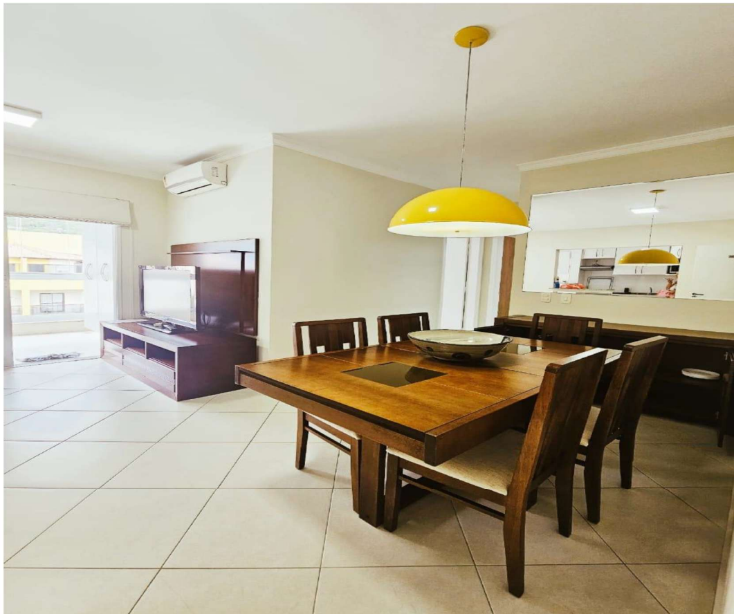
Entrada do Apartamento

Imóvel Avaliando: Imóvel residencial (Apartamento – 4º Andar), situado no Condomínio Residencial Mata Atlântica- Edifício Pau Brasil e Jatobá do Loteamento Costa Esmeralda; situado na Rua: Senador Severo Gomes, nº 173, apartamento 404, Bairro Praia Grande, município de Ubatuba/SP, CEP 11.687-504.