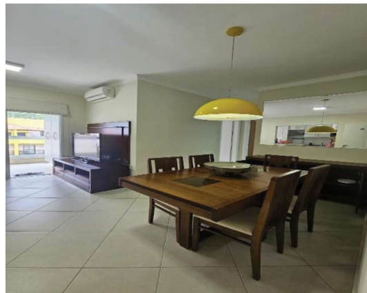
12 – Sala de Jantar