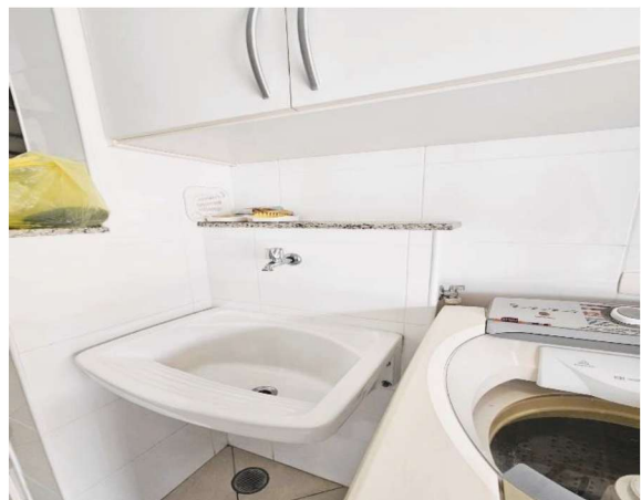
18- Parte da Lavanderia