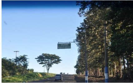
Representação Vista da Rua