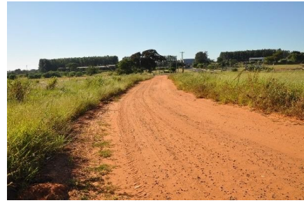
Representação Vista da Rua