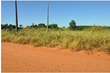
Representação Vista da Rua

Descrição vizinho eq. 1B (sem benfeitorias)