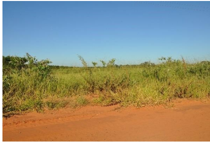
Representação Vista da Rua

Descrição vizinho dir. 3 (sem benfeitorias)