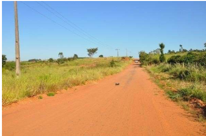
Representação Vista da Rua