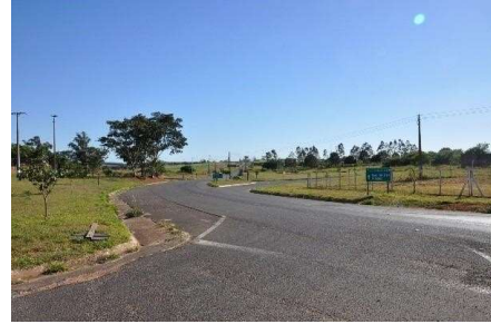
Representação Vista da Rua