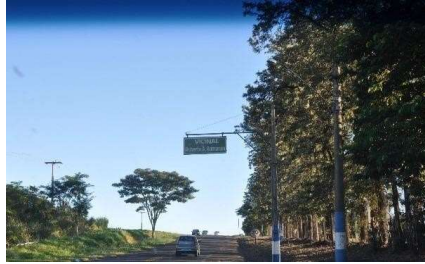
Representação Vista da Rua