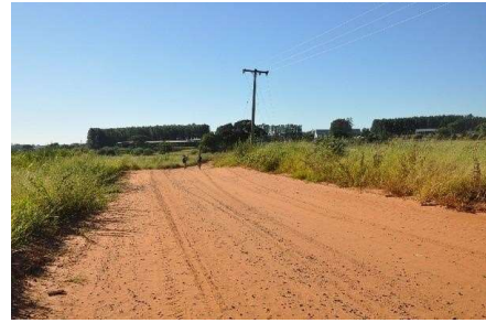
Representação Vista da Rua