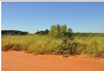
Representação Fachada Principal