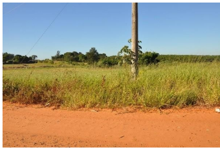
Representação Vista da Rua

Descrição vizinho esq. 4 (sem benfeitorias)