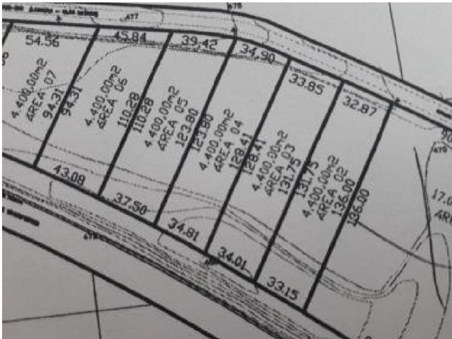
Representação: Planta de Quadra