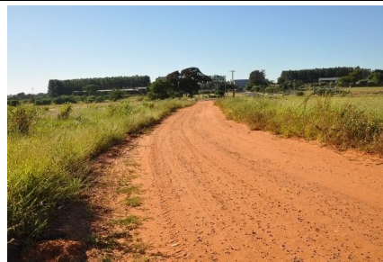
Representação Vista da Rua