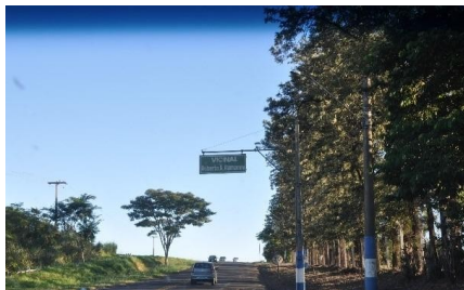
Representação Vista da Rua