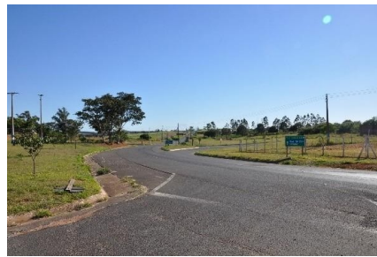
Representação Vista da Rua