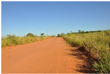
Representação Vista da Rua