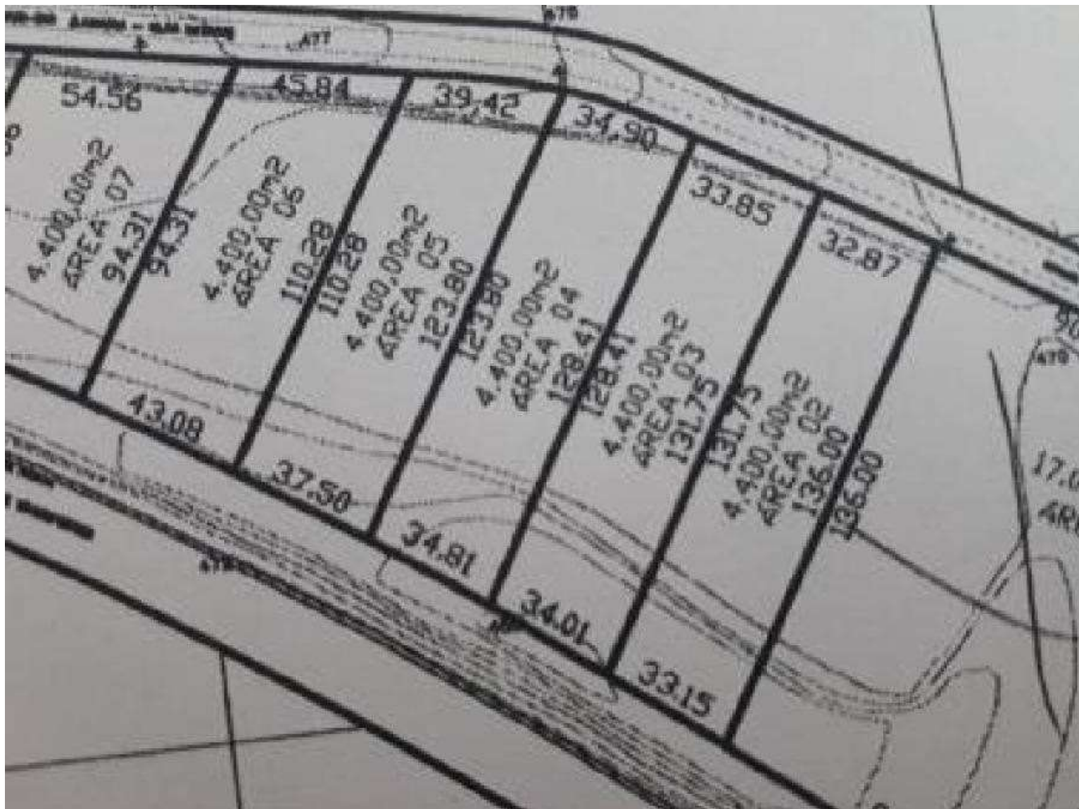
Representação: Planta de Quadra