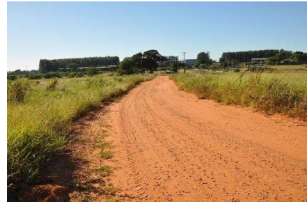
Representação Vista da Rua