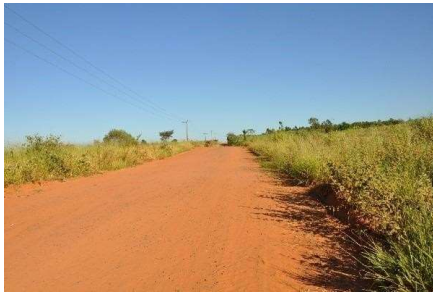
Representação Vista da Rua