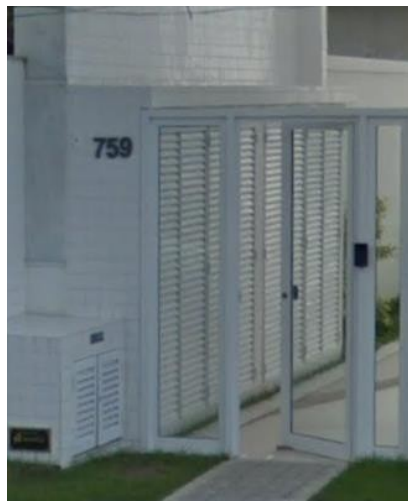
Representação Descrição Data Foto