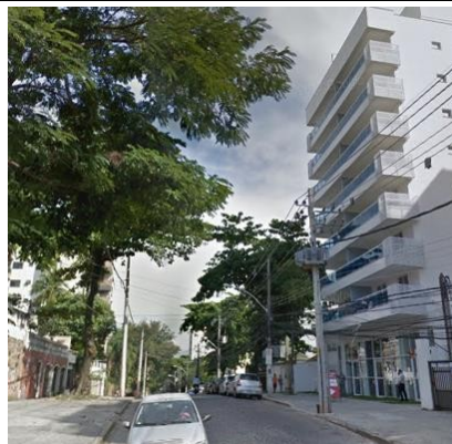
Representação Vista da Rua Descrição Data Foto