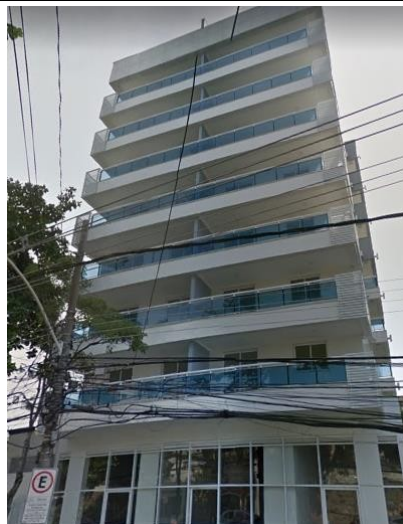
Representação Fachada Descrição Data Foto