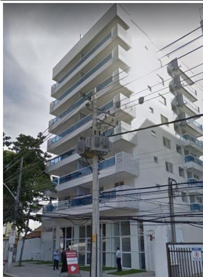
Representação Descrição Data Foto